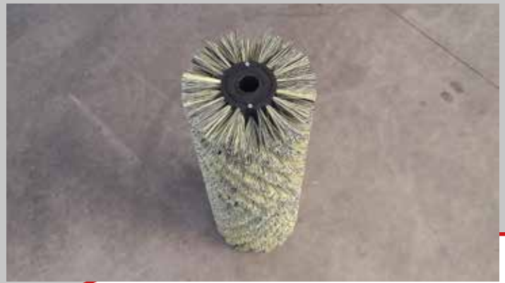
Spazzola in PPL / PPL brush