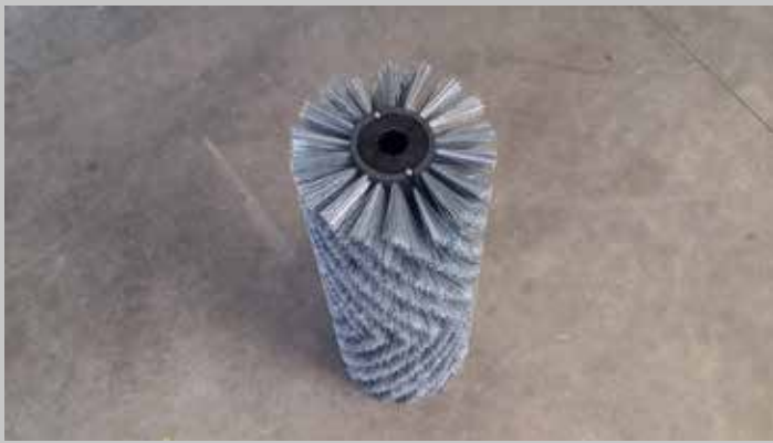
Spazzola in PPL-TYNEX / PPL-TYNEX brush Spazzola in TYNEX / TYNEX brush